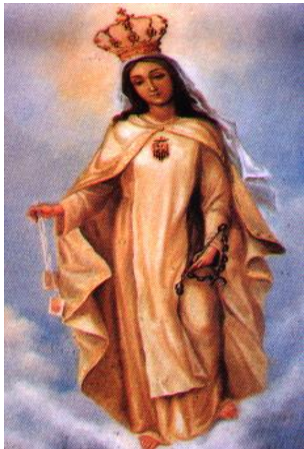
MARIA DE LA MERCED, MADRE EDUCADORA DE LA FE.